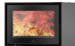
S709 + Wall PA1090G067

MEDIDAS / DIMENSIONS / DIMENSIONS / MISURE 710 x 580 x 460 mm