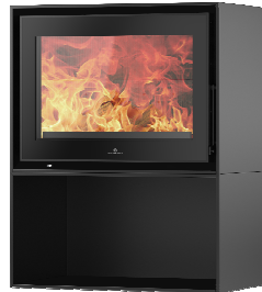
S709 + Cube PA2021N010

MEDIDAS / DIMENSIONS / DIMENSIONS / MISURE 710 x 982 x 460 mm