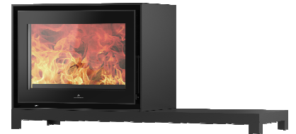
S709 + Table PA2021N011

MEDIDAS / DIMENSIONS / DIMENSIONS / MISURE 1305 x 684 x 460 mm