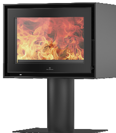
S709 + Round PA2021N012

MEDIDAS / DIMENSIONS / DIMENSIONS / MISURE 710 x 1008 x 460 mm