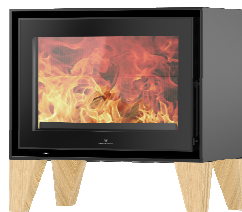
S709 + Wood PA2021N013

MEDIDAS / DIMENSIONS / DIMENSIONS / MISURE 710 x 784 x 460 mm