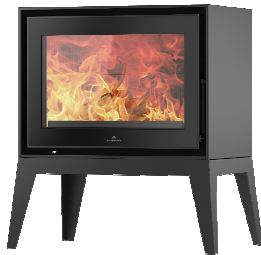
S709 + Spider PA2021N009

MEDIDAS / DIMENSIONS / DIMENSIONS / MISURE 769 x 930 x 521 mm