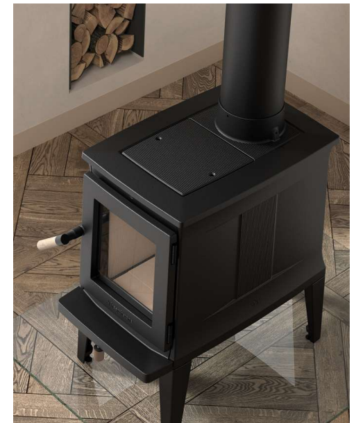
Calentador superior de hierro fundido esmaltado