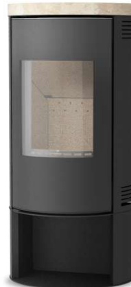
SR500 + Stone

MEDIDAS MEDIDAS / DIMENSIONS DIMENSIONS / MISURE